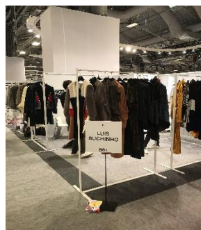
Berlin Fashion Week